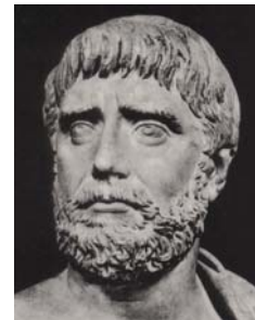
Thales von Milet